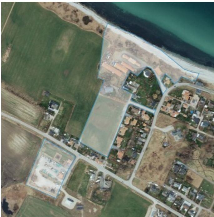
Lokalplanområdet i Havnebyen

• Lokalplanen kan læses på kommunens lokalplanportal eller i bilag 1 Kommuneplantillæg kan læses på kommunens lokalplanportal eller i bilag 2 Miljøscreening kan læses på kommunens lokalplanportal eller i bilag 3 Arkitektonisk kvalitetstjekliste kan læses i bilag 4