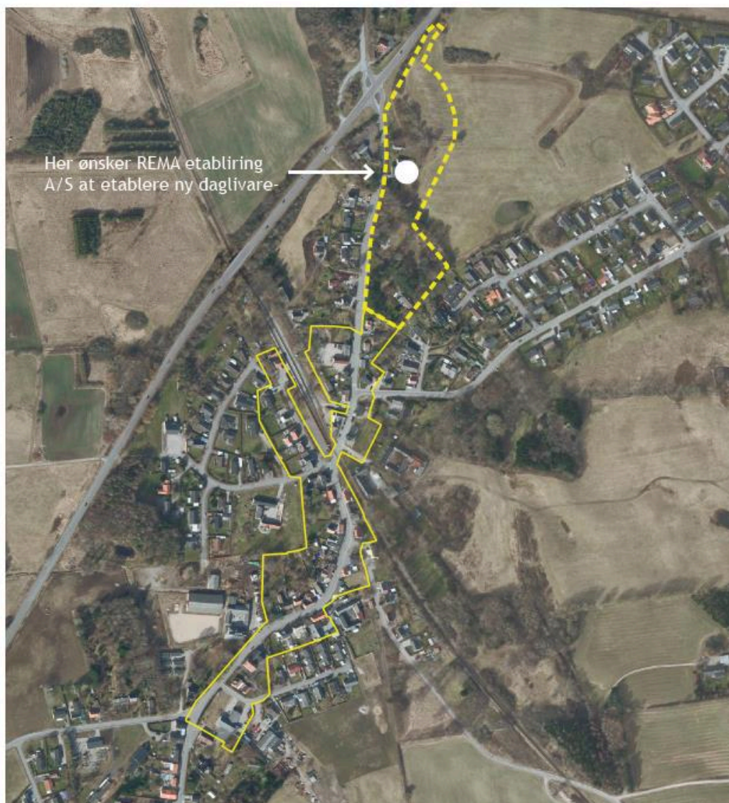
— Eksisterende detailhandelsstruktur - - - Udvidet detailhandelsstruktur

Den ønskede placering af en dagligvarebutik ud til hovedfærdselsåren mellem Nykøbing, Rørvig og rute 21, vil dog have en anden betydning for dagligvarehandlen i Odsherred end den placering kommuneplanen giver mulighed for i dag, med en dagligvarebutik centralt i Nr. Asmindrup / Svinninge. Derfor har kommunen bedt Rema1000 om at få udarbejdet en analyse af konsekvenserne for det øvrige butiksliv (bilag 3). Konsekvensanalysen estimerer med en omsætning på 40. mio. kr., hvor 10 mio. tages fra Nykøbing; 5 mio. fra Rørvig og Lyngkroen, 10 mio. fra Højby; 5 mio. fra Vig, 5 mio. fra Rema1000 i Lumsås og 5 Mio. fra "andre".