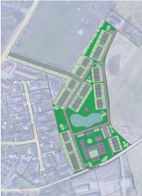
Figur 1 - Skitse af det ønskede projekt med vejforløb til Bobjergvej