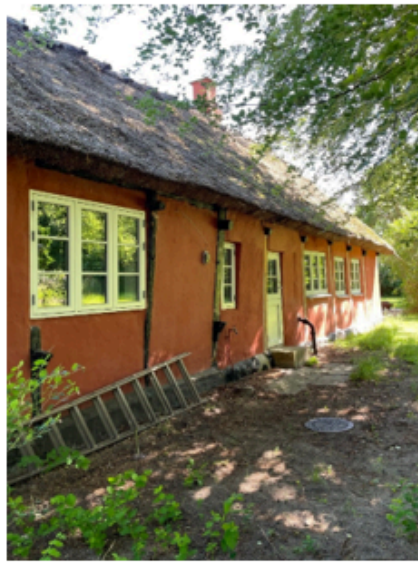
Kongepartens Strandvej 37, juni 2024