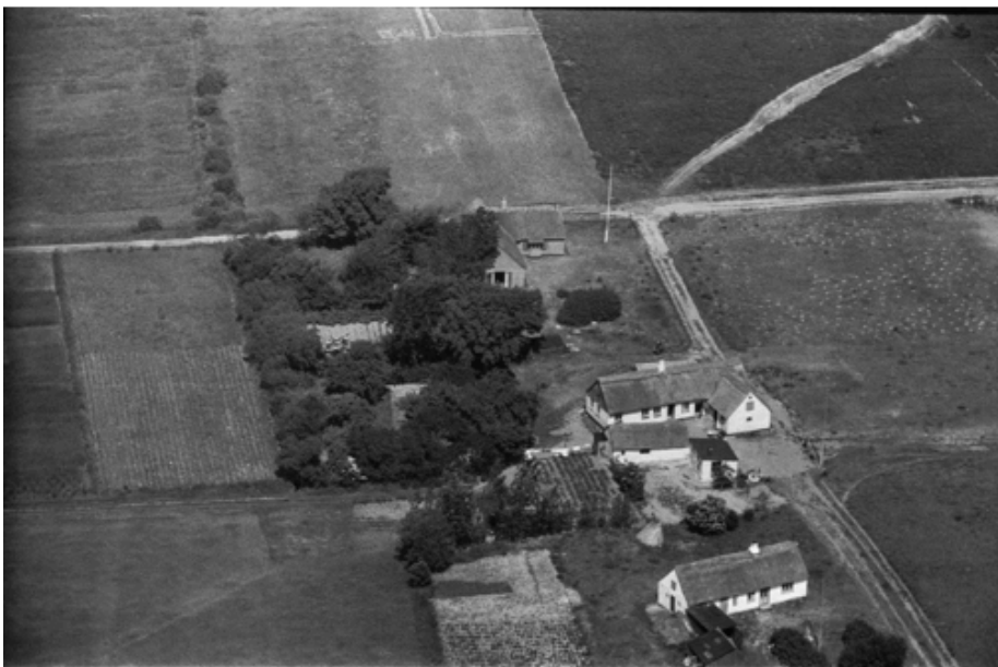
Danmark set fra luften, ca. 1950'erne. Kongepartens Strandvej 37, Ny Plantagevej 29A og 31