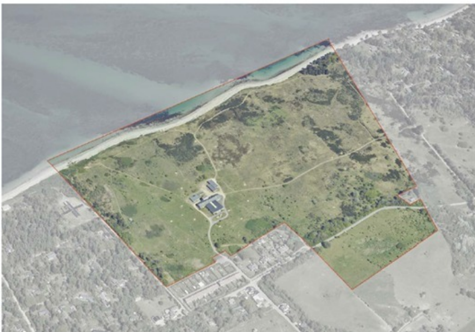
Lokalplanområdet Skamlebæksletten med den tidligere radiostation

Byrådet ønsker at der etableres et hotel af høj kvalitet for at skabe en attraktion og en udvikling indenfor kraftcenteret. Det er samtidig vigtigt for byrådet at offentlighedens adgang til området bevares og at naturkvaliteterne i området som minimum forbliver som de er i dag. For at skabe et unikt hotel med fundament i stedets historie ønsker byrådet at det afsøges hvorvidt det er muligt omdanne eksisterende bygninger til hotel. Er denne løsning ikke mulig, må der bygges nyt på eksisterende fundament.”