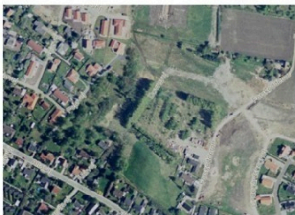
Området | 2006