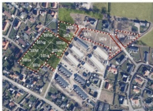
Projektområde indsendt af FA09 og Mangor og Nagel