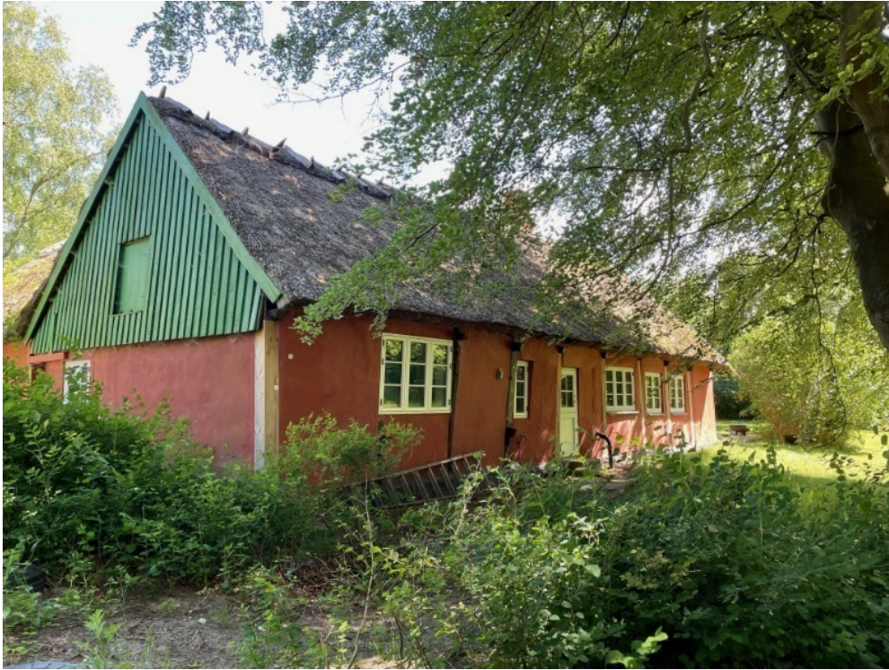
Bygning 1, i lokalplanområdet, på Kongepartens Strandvej 37. Foto: juli 2024.

Ved nedlæggelsen af § 14 forbuddet, bemærkede Byrådet, at det var ønskværdigt at udarbejde en lokalplan for et større sammenhængende sommerhusområde på Ellinge Lyng, i forbindelse med dette arbejde.