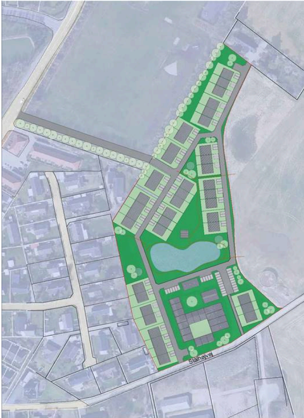
Figur 1 - Skitse af det ønskede projekt med vejforløb til Bobjergvej